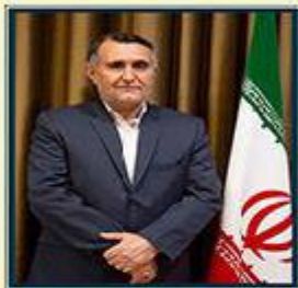
بهنام تبریک فرماندار ویژه شهرستان سیرجان به ریاست دانشگاه